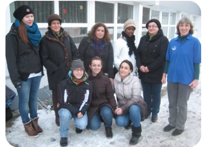
Gruppe I und II