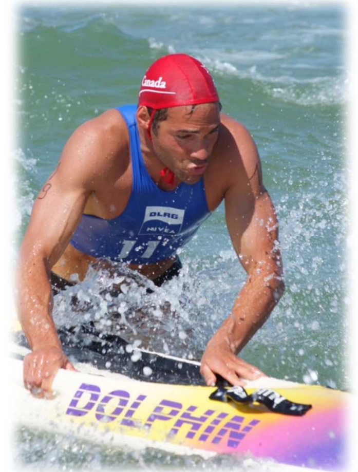
Der Kampf mit den Wellen - hier ein kanadischer Athlet bei der Rescue2008 - fasziniert immer mehr Menschen.